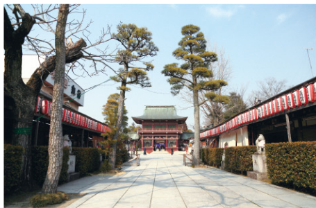
笠間稲荷神社 参道