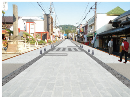
新しい石畳の門前通り