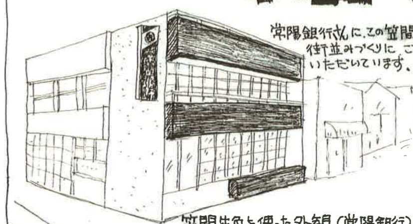
常陽銀行にこの笠間朱色の街並みづくりにご協力いただいております。

かさまち考ではガイドラインに沿って公的な空間を笠間朱色に塗る取組みを行ってきました。今後も、笠間朱色の取組みを継続していく予定です。