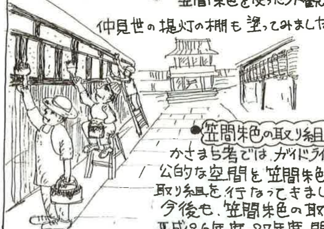
仲見世の提灯の柵も塗ってみました。

かさまち考ではガイドラインに沿って公的な空間を笠間朱色に塗る取組みを行ってきました。今後も、笠間朱色の取組みを継続していく予定です。