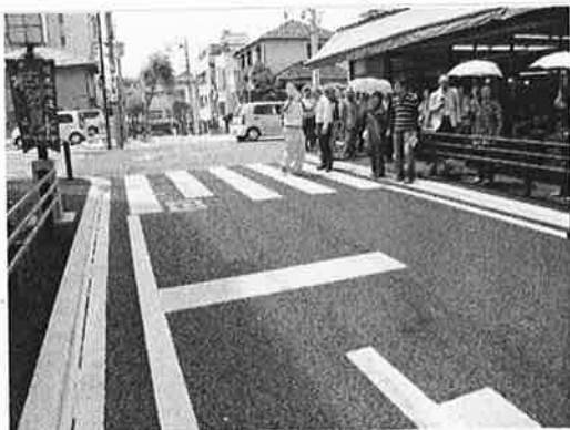
よこまち柳通り【古河市】

今回の視察は、車がスピードを出さず歩行者の安全を確保できる道路形態や年配者も歩きやすい路面の素材などを考える上で勉強になりました。また、自分たちが観光客の立場でまちを見ることができ、門前通りに相応しい道路景観やまち並みを改めて考える良い機会となりました。