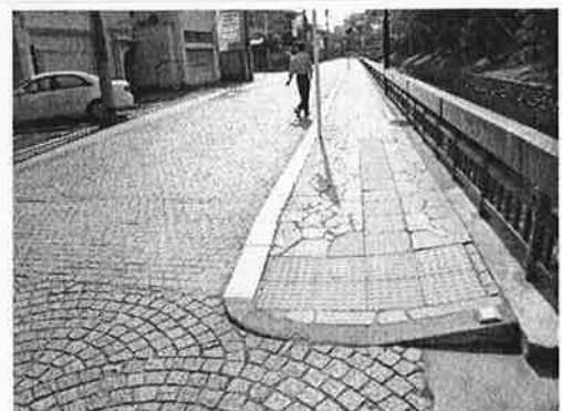
史跡足利学校周辺の道【足利市】